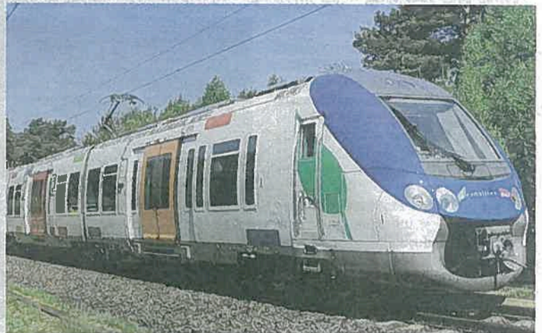
Déjà en service sur les tronçons Paris-Nord-Luzarches et Paris-Persan via Montsoult, le Francilien équipera toute la ligne H du Transilien d'ici à la fin de l'année.